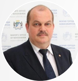
Ахметгареев Рамиль Миргазянович начальник департамента образования мэрии города Новосибирска